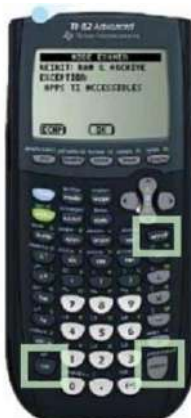
TI 82 Advanced