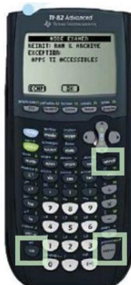
TI 82 Advanced