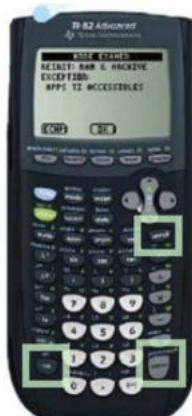
TI 82 Advanced