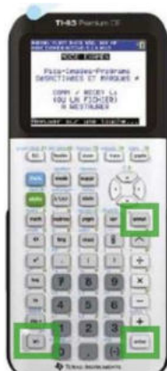
TI 83 CE