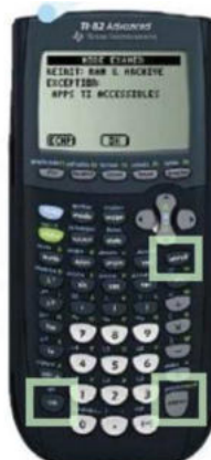
TI 82 Advanced