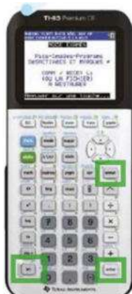
TI 83 CE