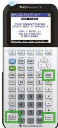
TI 83 CE