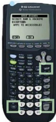
TI 82 Advanced