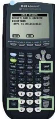
TI 82 Advanced