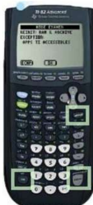
TI 82 Advanced