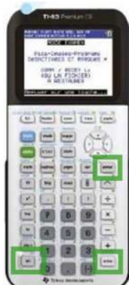
TI 83 CE