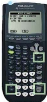
TI 82 Advanced