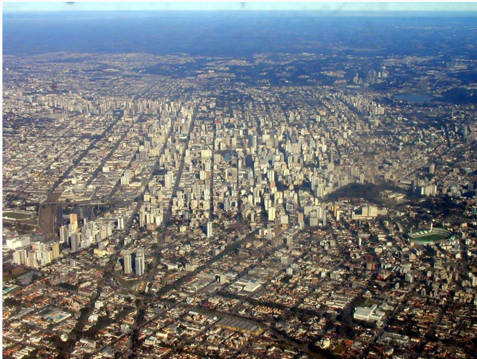
Hervé Théry. Cliophoto, juillet 2006

Voir aussi sur le site de Télérama les photographies illustrant l'article précédemment cité :